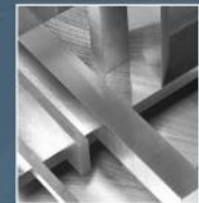
PRECIZ® - broušená ocel