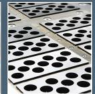
Desky na formy