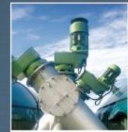
Dávkovací systémy - bioplyn